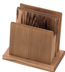
焼杉メニューナブキン立

19-405-12(16336) 5,700円 約27×12×H8cm / 上部内寸約25.8×8.4cm