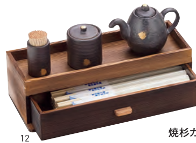
焼杉カスター&箸箱

19-405-11(16313) 1,750円 約20.2×12.4×H1.5cm / 内底寸約16.5×9.5cm ※つり銭トレイにもご利用いただけます。