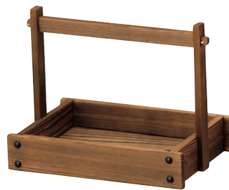
焼杉手付カスター(大)

19-405-14(16309) 2,400円 約9.8×9.8×H14.2cm